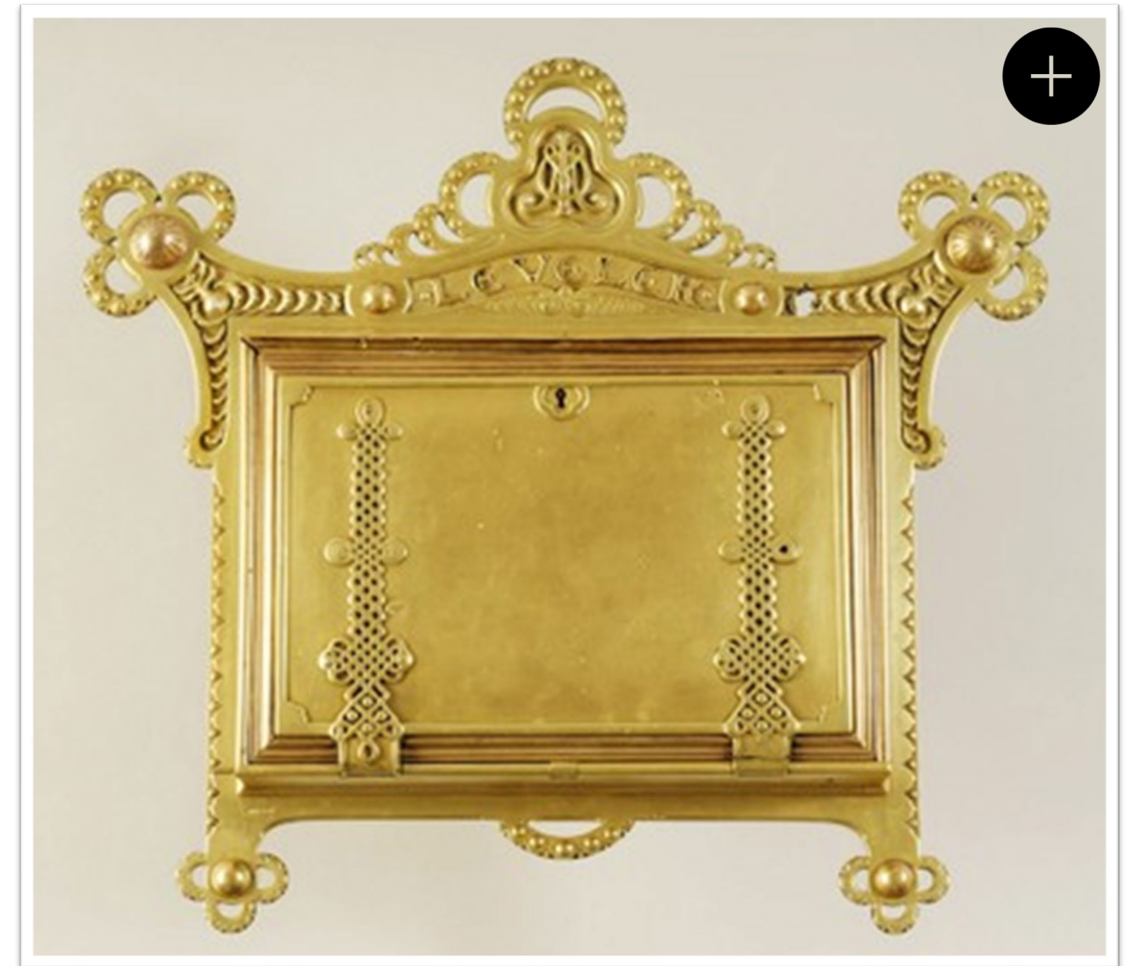
Postaláda Alkotó: Jungfer Gyula Budapest, 1896 Sárgaréz