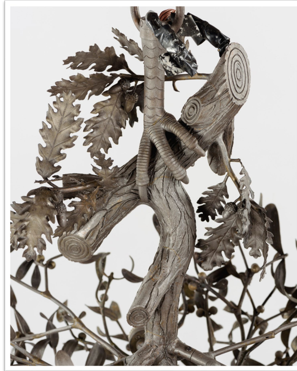
Függőlámpa (fagyöngycsillár) Alkotó: Jungfer Gyula Budapest, 1890-es évek vége Kovácsoltvas