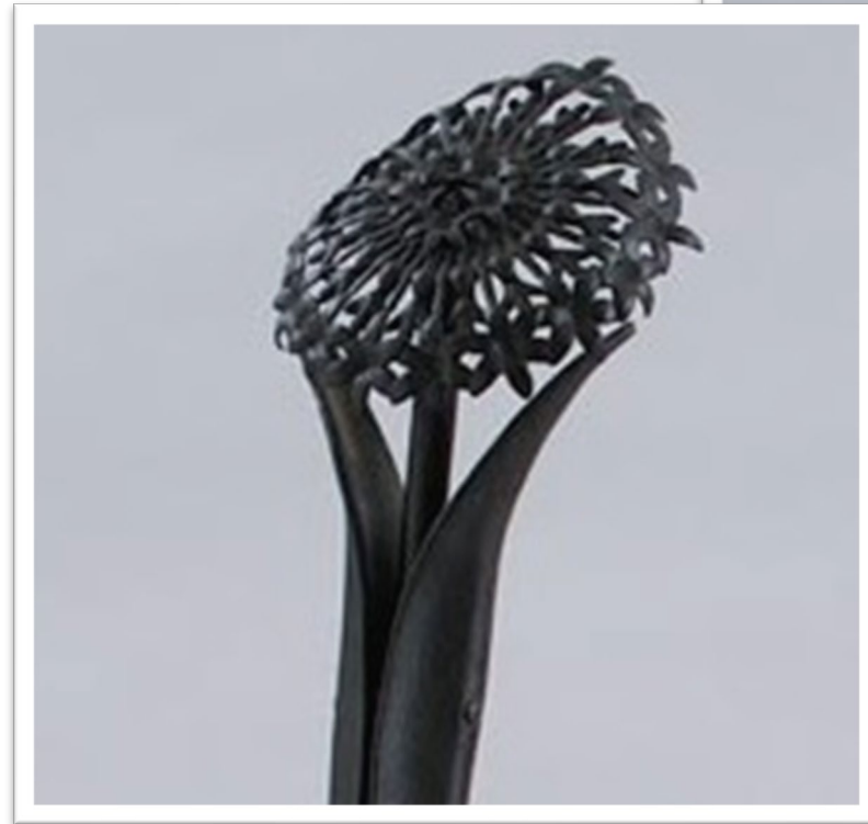
Tűzbakpár Terv: Louis Majorelle Nancy, 1900 körül Kovácsoltvas